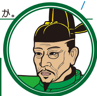
豊臣 秀吉 (とよみ ひでよし) (1537~1598年)

Q. 豊臣秀吉が天下統一に向けて取り組んだことと、そのことに 関係ある資料を線で結びましょう。