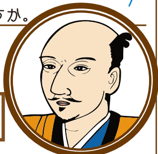
織田 信長 (おだのぶなが) (1534~1582年)

Q. 織田信長が天下統一に向けて取り組んだことと、そのことに 関係ある資料を線で結びましょう。