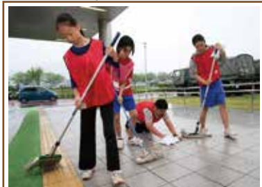
【熊本地震】避難の子供たちがボランティア