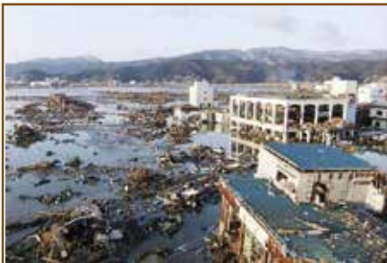
東日本大震災による津波で浸水した岩手県陸前高田市 平成23年3月12日

地震国と言われる日本では、1995年に、阪神・淡路大地震、2011年には、(東日本大震災・濃尾大地震)、さらに2016年に熊本地震がおり大きな被害をもたらした。被災した地域には、多くの (ボランティア・ファンクラブ) が支援に集まり、人々の支えとなりました。