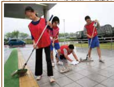
【熊本地震】避難の子供たちがボランティア