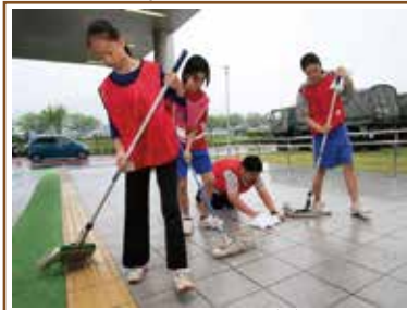
【熊本地震】避難の子供たちがボランティア