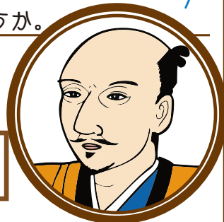
織田 信長 (おだ のぶなが) (1534~1582年)

Q. 織田信長が天下統一に向けて取り組んだことと、そのことに 関係ある資料を線で結びましょう。