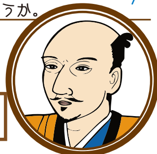
織田 信長 (おだ のぶなが) (1534~1582年)

Q. 織田信長が天下統一に向けて取り組んだことと、そのことに 関係ある資料を線で結びましょう。